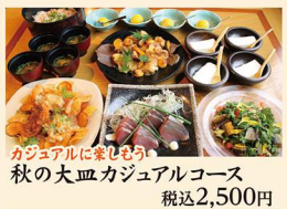
カグザルに楽しむ 秋の大皿カジュアルコース 税込2,500円